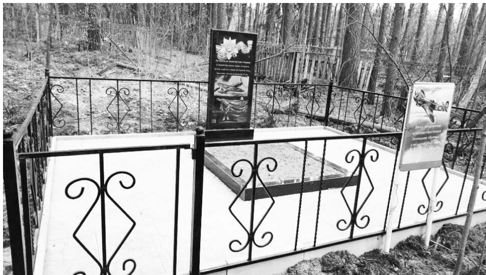
Воинское захоронение в д.Сорочка.