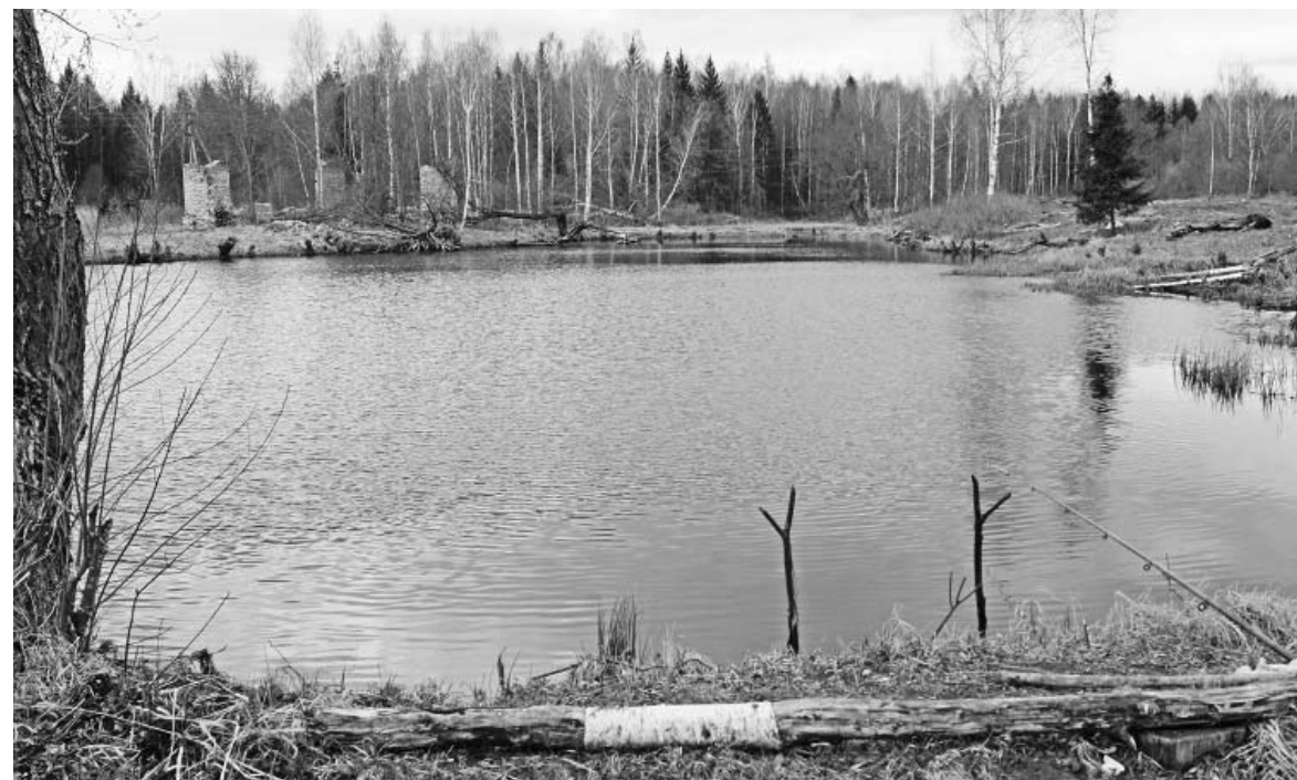
Пруд в п.Марьинский.